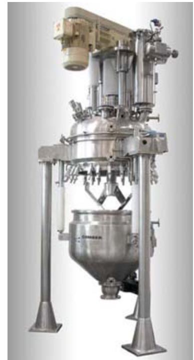
Condry ® Vertikal-Vakuum-Trockner mit konischem Unterteil