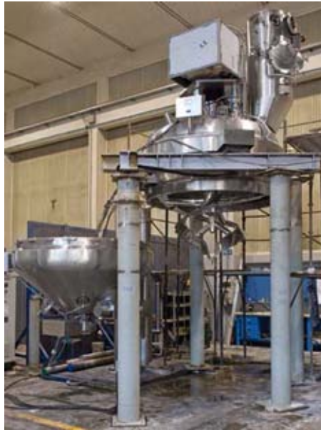
Condry ® TDC 3500 mit abgesenktem konischem Unterteil

Die Condry ® Vakuum-Schaufel-trockner in vertikaler Bauart mit konischem Boden-Unterteil wurden als äußerst universell einsetzbare Trockner konzipiert. Diese Trocknerbauart bewährt sich speziell für das Trocknen schwieriger Produkte, wie Produkte, die zur Bildung von Agglomeraten neigen, als auch für klebrige oder wärmeempfindliche Produkte.